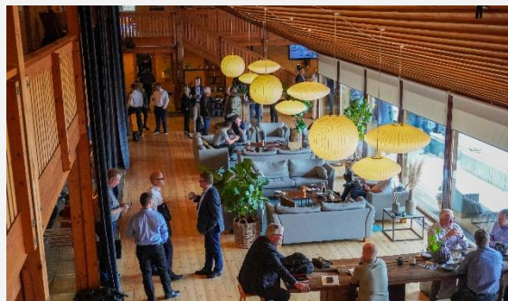
Foreningsdagen 2022 var velbesøgt - i alt deltog ca. 120 medlemmer.

Det var en festdag, da Foreningsdagen 2022 fandt sted på Klarskovgaard i Korsør. For første gang i tre år var det nemlig muligt at samle foreningens medlemmer til en fysisk foreningsdag med medlemsmøder og temamøder - og ikke mindst masser af mulighed for at hilse på andre i branchen.