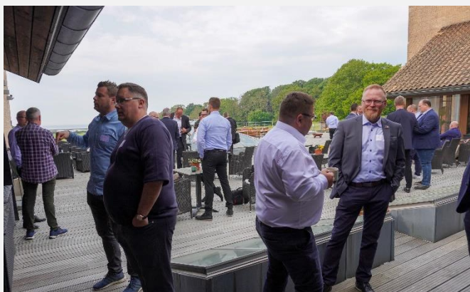
Der var masser af tid til at hilse på kolleger fra branchen.

I sekretariatet takker vi de ca. 120 medlemmer, der deltog i arrangementet, ligesom vi takker de mange oplægsholdere, der delte ud af deres viden på temamøderne. Vi ønsker desuden de valgte udvalgsledelser og bestyrelsesmedlemmer tillykke. Vil du se, hvem der sidder i de forskellige udvalgsledelser, læse formændenes beretninger eller se/gense præsentationerne fra oplægsholderne, kan du logge ind på SikkerhedsBranchens hjemmeside.