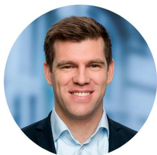
Morten Dahlin Formand Folketingets Retsudvalg

Torsdag 16. juni besøger SikkerhedsBranchen solskinsøen over dem alle - foreningen er nemlig repræsenteret på dette års Folkemøde på Bornholm. SikkerhedsBranchen er vært for en debat i Det Kriminalpræventive Råds telt kl. 13.30-14.30, og vi har inviteret en række spændende gæster med i panelet: